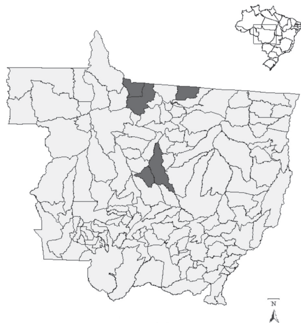
Figura 1 - Municípios de Alta Floresta, Guarantã do Norte e Paranaíta (Norte), Lucas do Rio Verde e Sorriso (Centro), nos quais foram encontrados espécimes de Panstrongylus lignarius no Estado de Mato Grosso, Brasil.

do Norte (lat. 09°47'15" Sul e long. 54°54'36" Oeste). Em novembro de 2009, o último espécime foi encontrado no município de Sorriso (lat. 11°43'38" Sul e long. 55°06'36" Oeste), próximo a região denominada de Área Verde localizada na área central da cidade, capturado por morador, no peridomicílio (Figura 1). Os municípios de Alta Floresta, Guarantã do Norte e Paranaíta, situam-se no Norte do Estado cuja vegetação é constituída por Floresta Ombrófila Aberta e Densa, Floresta Estacional e Savana, característica de Floresta Amazônica. Os municípios de Lucas do Rio Verde e de Sorriso estão localizados na micro-região geográfica Alto Teles Pires,